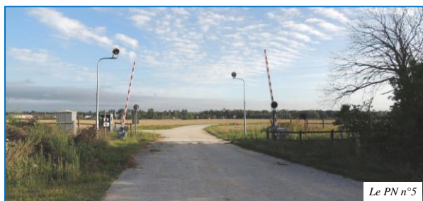
Le PN n°5

Et concernant la traversée de la voie ferrée par les piétons et autres véhicules, elle reste possible en empruntant le PN n°5 qui est, quant à lui, parfaitement balisé et sécurisé avec une signalétique claire et complète.