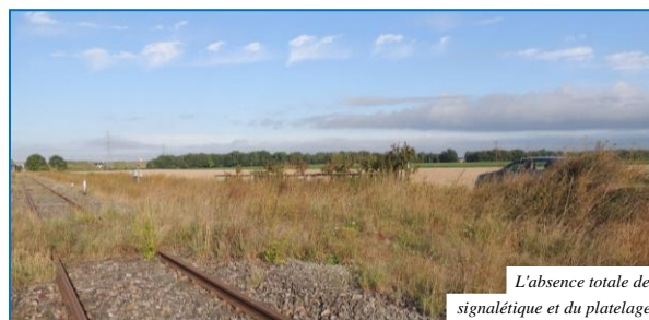
L'absence totale de signalétique et du platelage

Pour confirmer l'état des lieux décrit dans le rapport de M. Christophe Pouillon de SNCF Réseau, je constate l'absence totale de la signalétique originelle ainsi que celle du platelage.